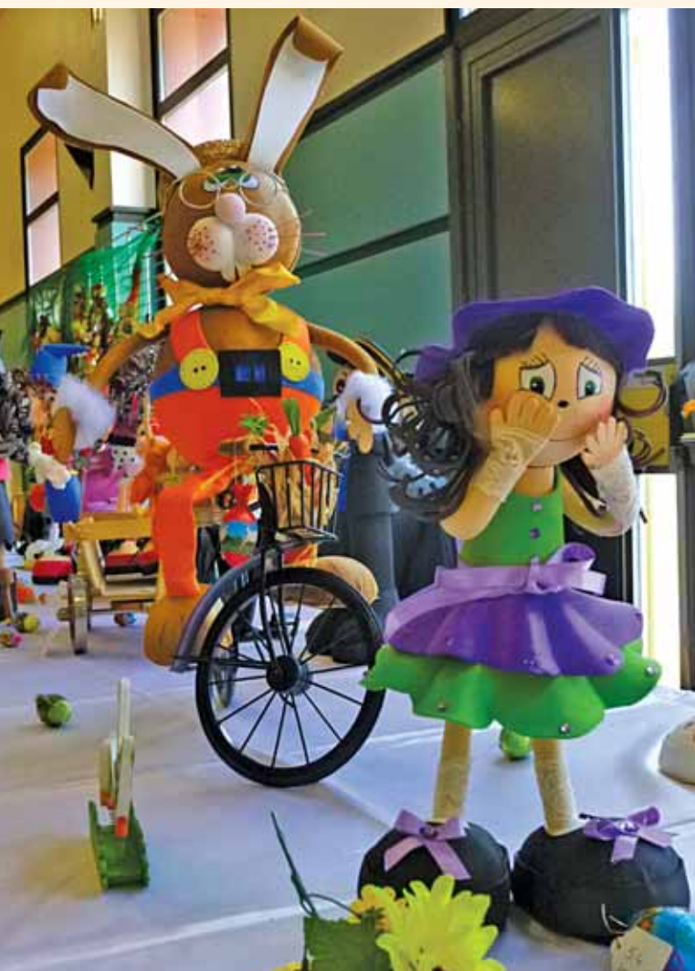
Marché de Pâques, Hégenheim Animations