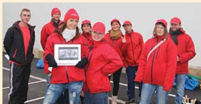
Jeunesse et Avenir, l'équipe d'animation à l'honneur