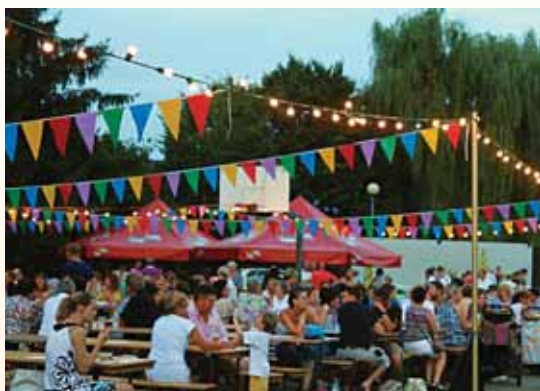
Bal du 14 juillet

Les associations de Hégenheim sont nombreuses à participer au rayonnement de notre commune. Bravo à elles !