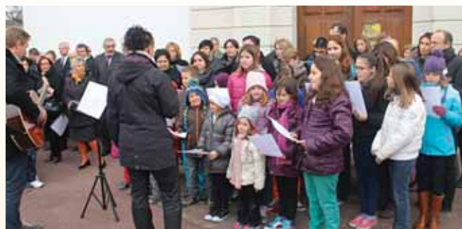
Cérémonie du 11 novembre, chorale des jeunes