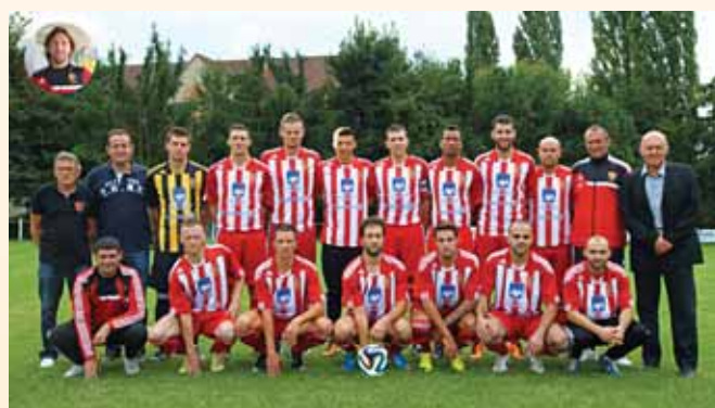
FC Hégenheim, vice-champion d'Alsace, juin 2014