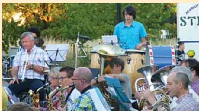
Fête de la musique 2014