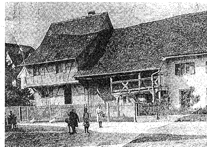
La maison dite du rabbin au début du XIXe siècle