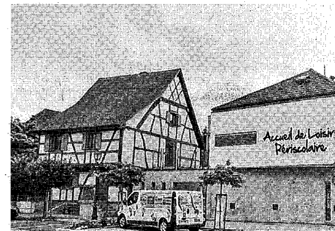
La maison du rabbin aujourd'hui.