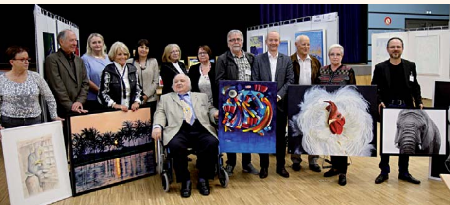
Expo des Artistes.