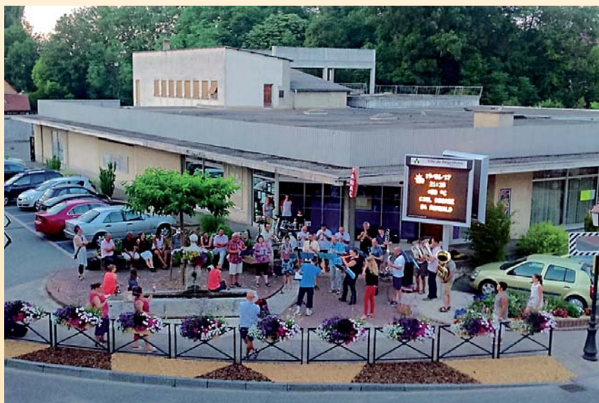
Fête de la musique.

Si vous souhaitez valoriser votre association ou faire publier des informations d'intérêt communal, n'hésitez pas à nous contacter : mairie@hegenheim.fr