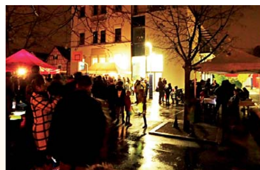
Saint-Martin à l'école.