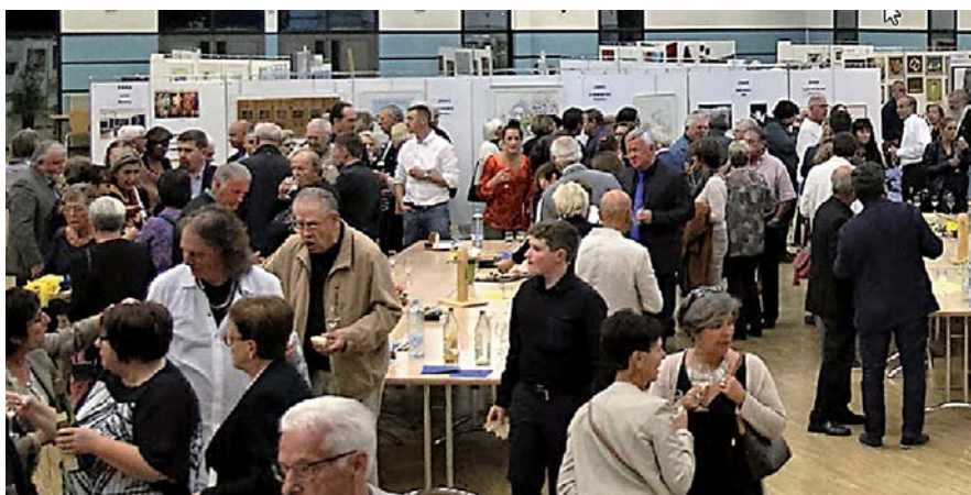
20 e salon des artistes.