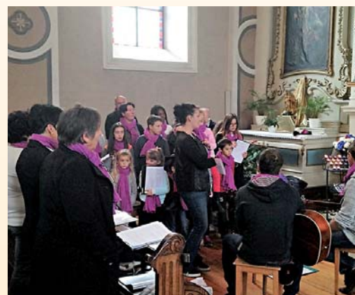
Chorale des jeunes.