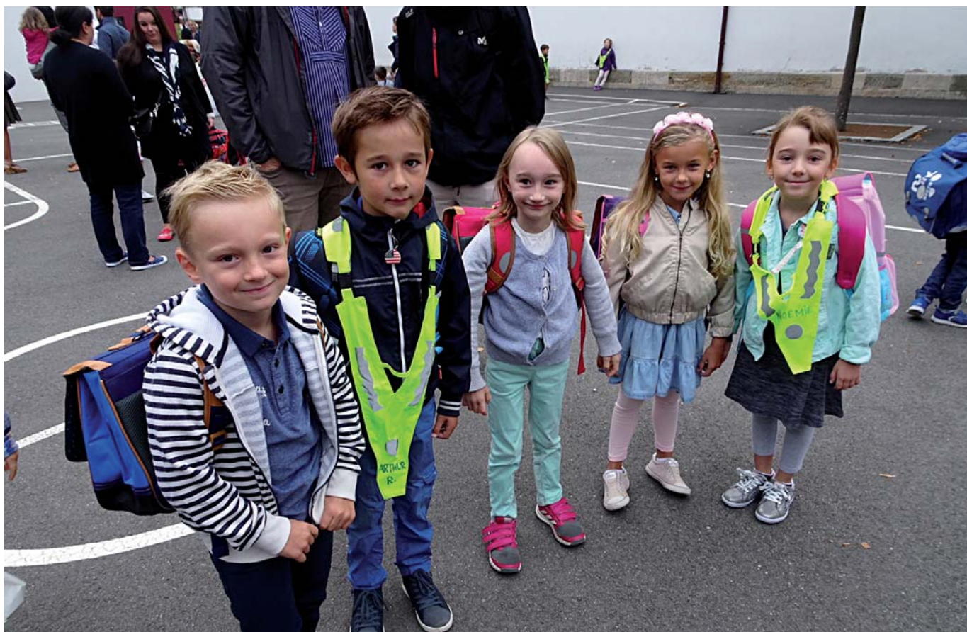
Rentrée en CP.